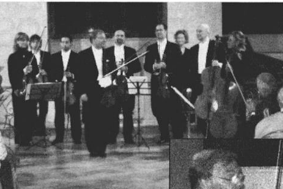
Il concerto di Hink con "i Solisti di Perugia"

Primo violino e maestro concertatore dei Wiener Philharmoniker, la grande orchestra della capitale austriaca che ogni anno entra nelle case degli italiani con il concerto di Capodanno trasmesso in mondovisione, Hink