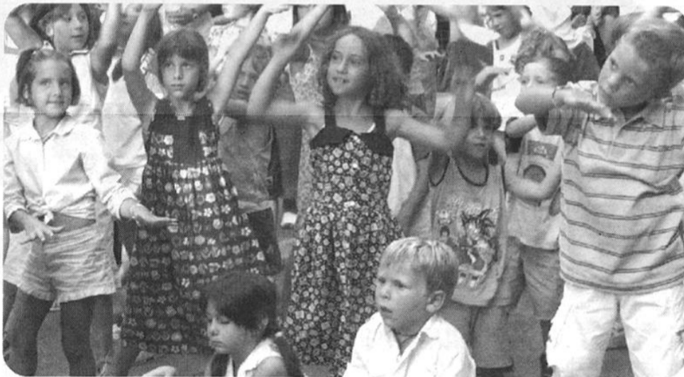
Un'immagine delle precedenti edizioni del Fantasio Festival