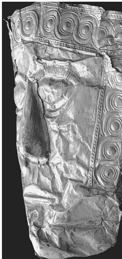
Uno dei reperti archeologici che saranno in mostra