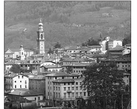
Una panoramica di Breno