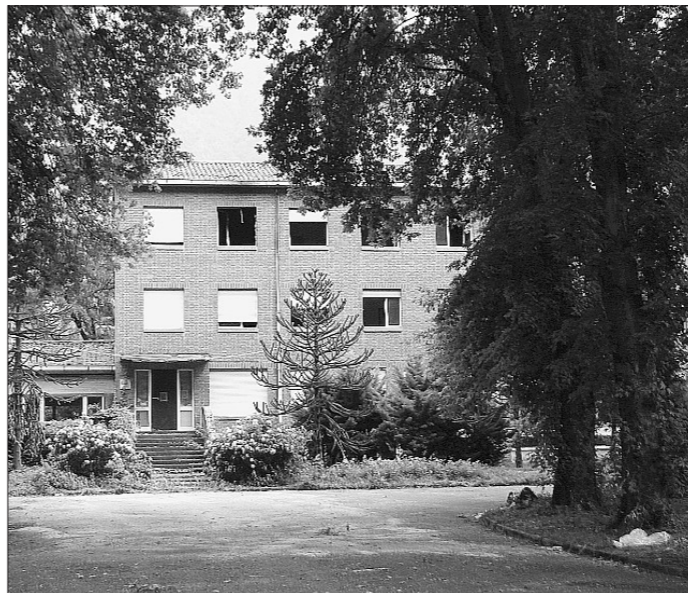
L'istituto della «ex Consolata»

Sono previste anche opere di abbattimento delle barriere architettoniche e la sostituzione degli impianti tecnici esistenti (elettrico, termoidraulico e antincendio). L'impresa Sandrini Spa di Casalmoro (Mantova), vincitrice dell'appalto, entro 365 giorni dovrà realizzare nove aule didattiche, due laboratori di informatica, un laboratorio di acconciature e uno di estetica, tre blocchi di servizi igienici, due spogliatoi con docce, la sala professori e tre uffici segreteria.